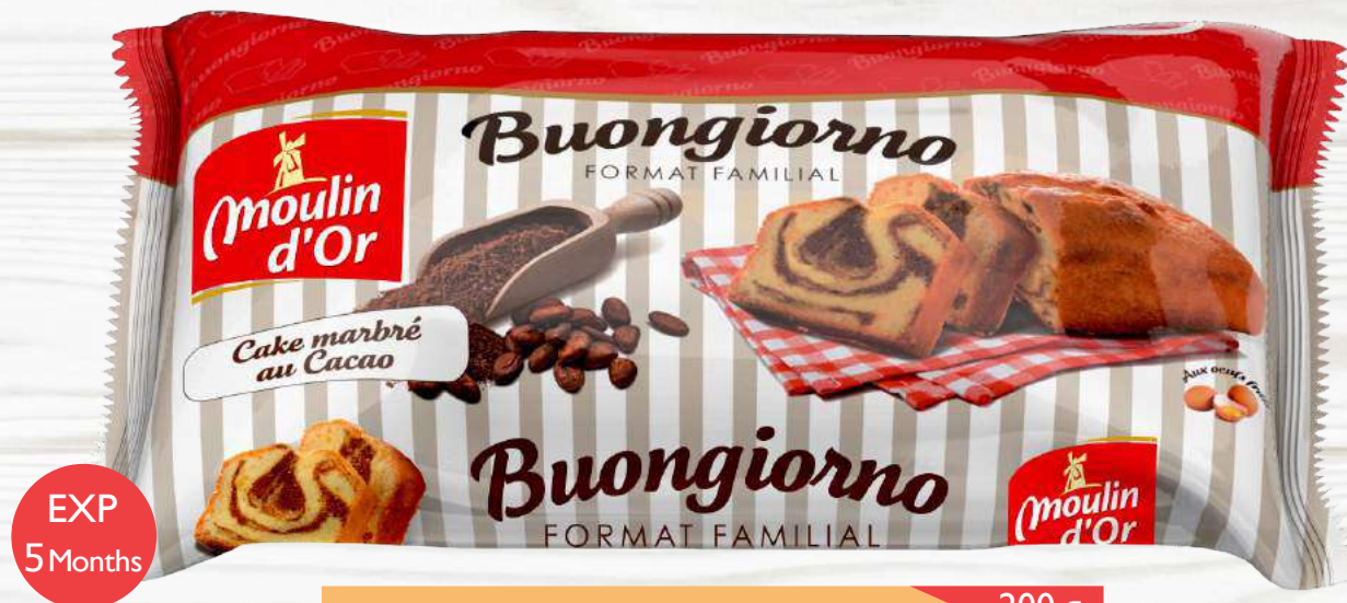
Buongiorno marbled marbled cocoa cake