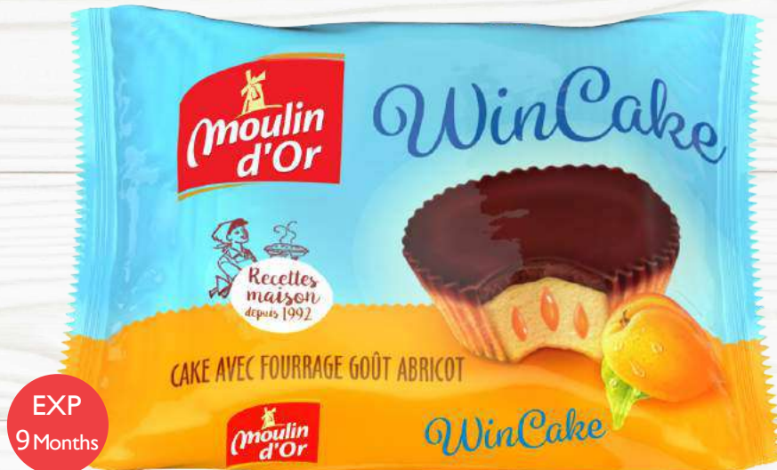
Wincake Apricot with apricot jam filling