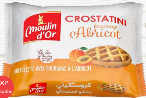
Crostatini Apricot 70 g with apricot jam filling