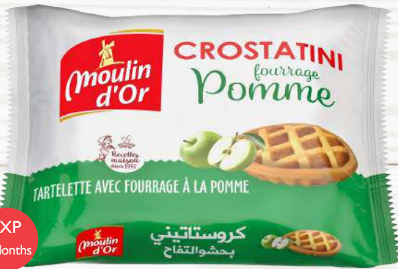
Crostatini Apple 70 g with apple jam filling