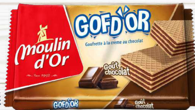
GOFD'OR 80G Crispy wafer filled with cocoa cream-chocolate flavored