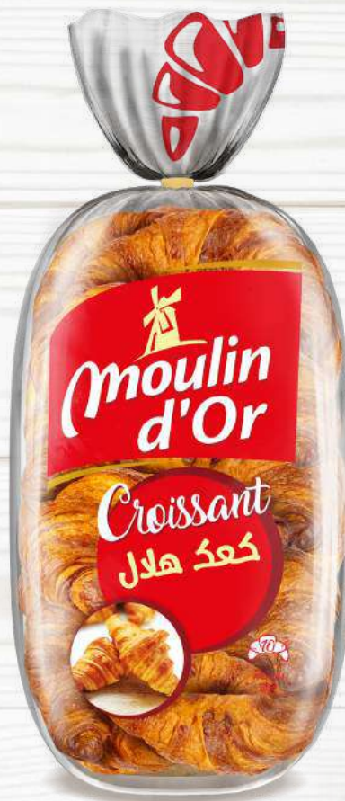
pieces 10 CROISSANTS