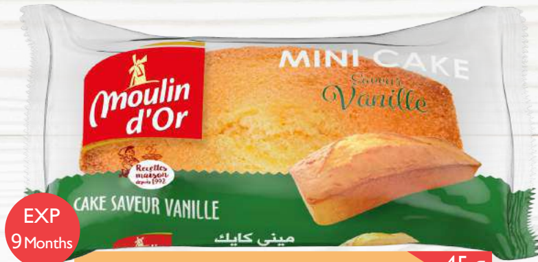
Mini cake Vanilla vanilla flavored cake