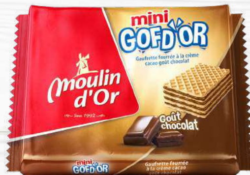
GOFD'OR mini 30G Crispy wafer filled with cocoa cream-chocolate flavored