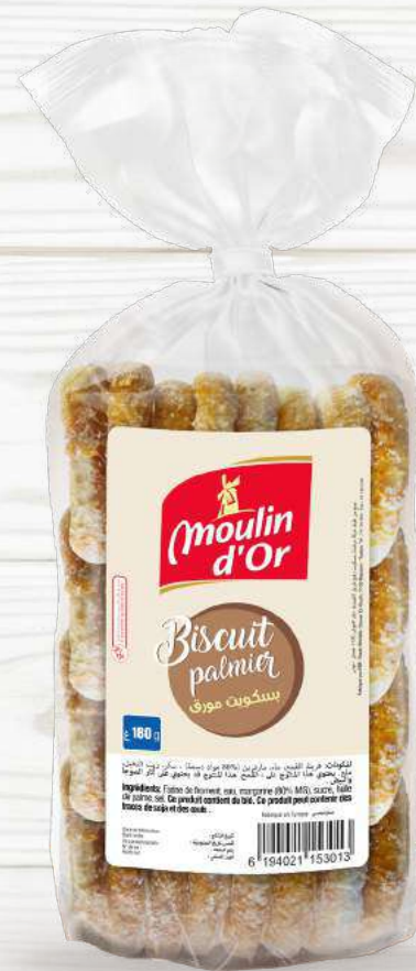
180 g PALMIERS