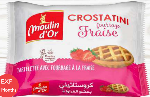
Crostatini Strawberry 70 g with strawberry jam filling