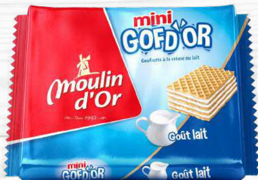
GOFD'OR mini 30G Crispy wafer filled with milk flavored cream