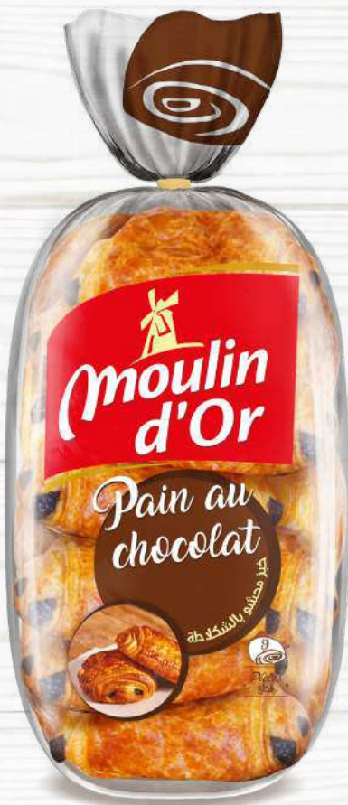
pieces 9 PAIN AU CHOCOLAT