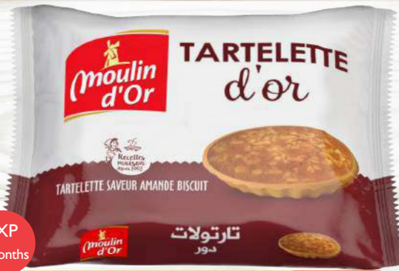
Tartelette d'or 70 g almond and biscuit flavored pie