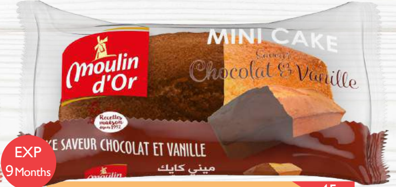
Mini cake Chocolate / Vanilla chocolate and vanilla flavored cake