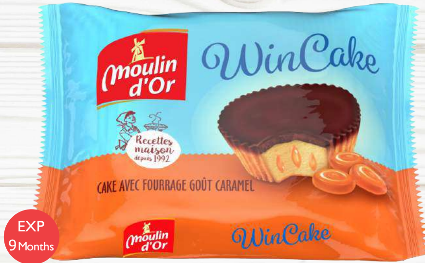
Wincake Caramel with caramel filling