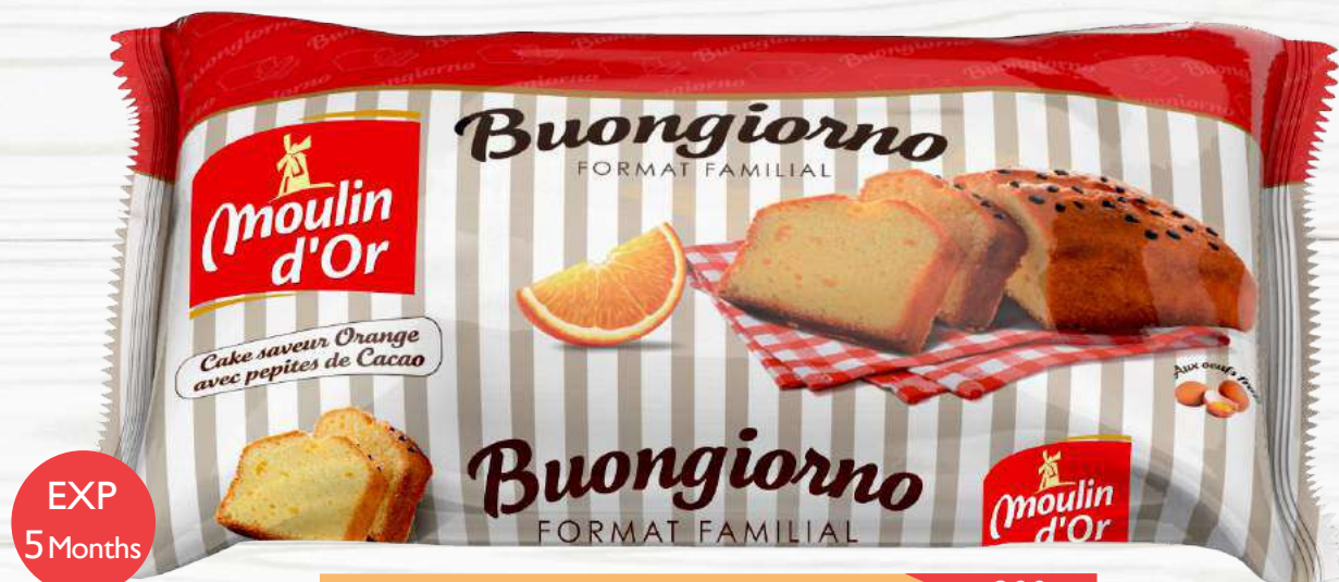
Buongiorno orange orange flavoured cake with cocoa chips