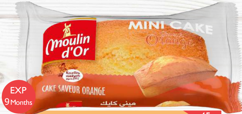
Mini cake Orange orange flavored cake