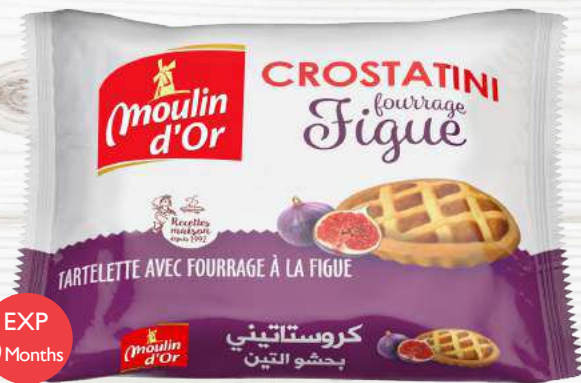
Crostatini Fig 70 g with fig jam filling