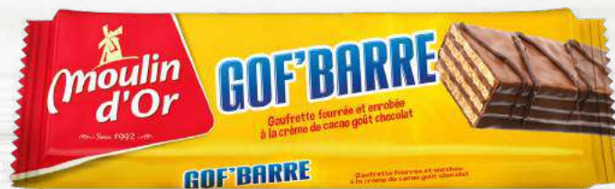
GOF'BARRE 25G Crispy wafer and filled with cocoa-chocolate flavored cream