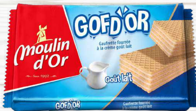
GOFD'OR 80G Crispy wafer filled with milk flavored cream