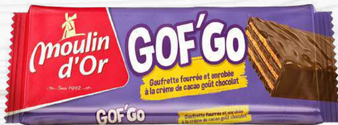
GOF'GO 16,5G Crispy wafer coated and filled with cocoa-chocolate flavored cream